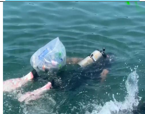
台南市環保艦隊在將軍魚港淨海，1小時清除廢棄物達300多公斤。