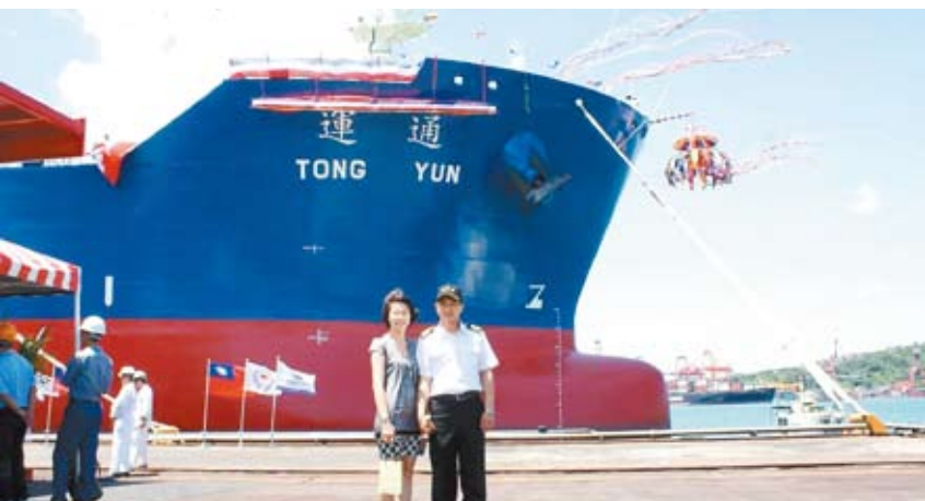
中油建造自有船隊，以運送提煉過的成品油。

「海洋運輸」是指利用海上運具將人或貨物藉由航線，安全、即時且經濟地由一個港口運送到另一個港口的過程。其構成要素即船舶、航海科技、港埠、航海人員、貨物、旅客以及組織等。台灣因海島型地貌地狹人稠，天然資源有限，經濟成長的主要來源為貿易，藉由進口天然資源或半成品，加工後再出口，以賺取中間的附加價值。然依交通部的資料顯示，2015年進出口貨物的運輸有近99%係仰賴海洋運輸。故海洋運輸對於台灣的貿易發展占了極大的重要性。