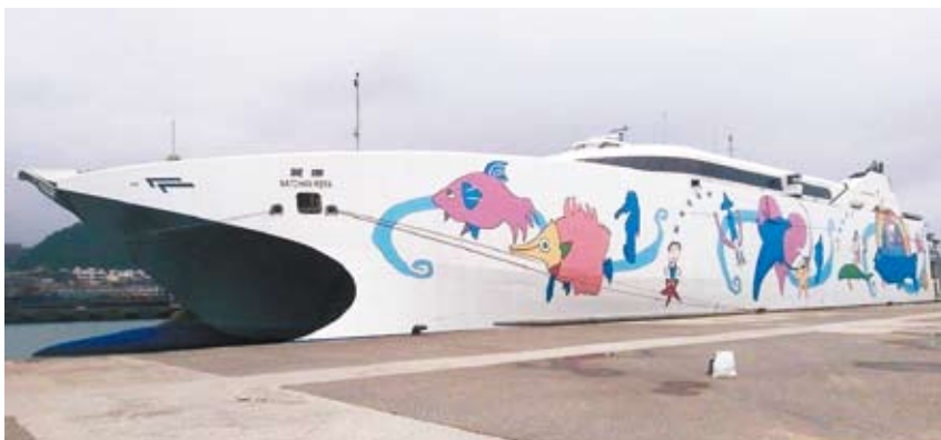
固定往返蘇澳港及花蓮港的麗娜輪，停泊於基隆港。