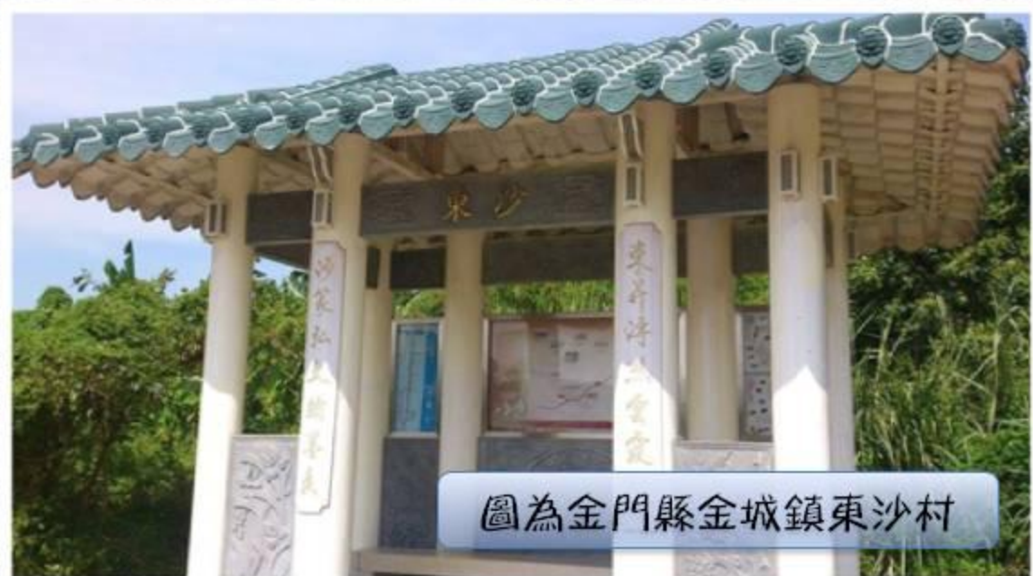
圖為金門縣金城鎮東沙村