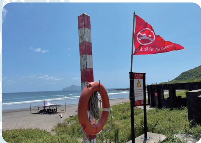
▲ 臺灣海邊警示標語。