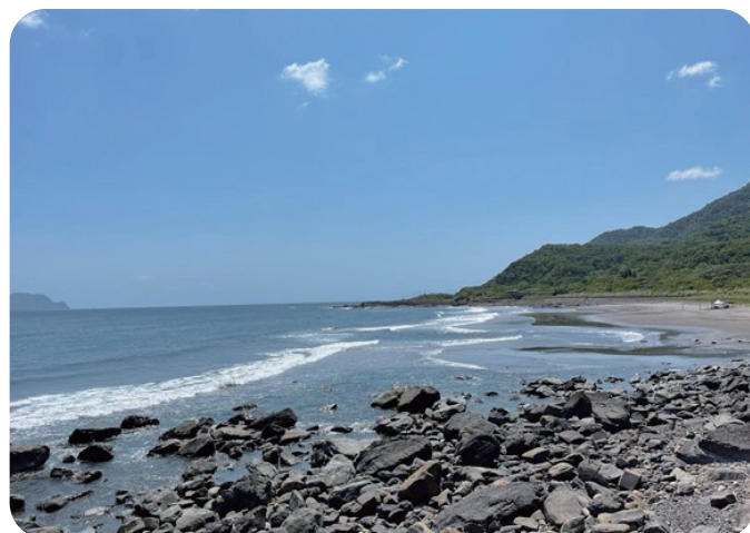
▲ 宜蘭縣頭城鎮蜜月灣離岸流。