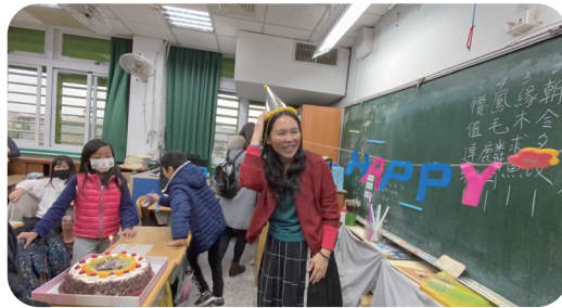
▲ 為了增添氣氛，家長準備了裝飾物，出現部分的塑膠製品。孩子們頓時成為小小監督員，對家長說：「這些佈置沒有減塑耶！」家長說：「這些是使用二手的喔！」其中橫跨教室，五彩繽紛的Happy birthday紙條，是家長為了減塑，一刀一刀手