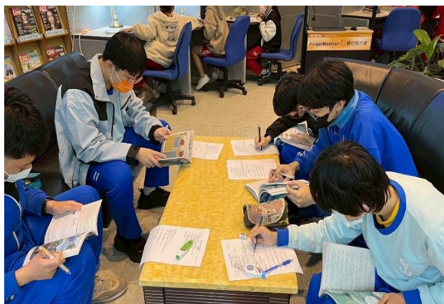
說明：閱讀推動海話嬉遊記共讀書1