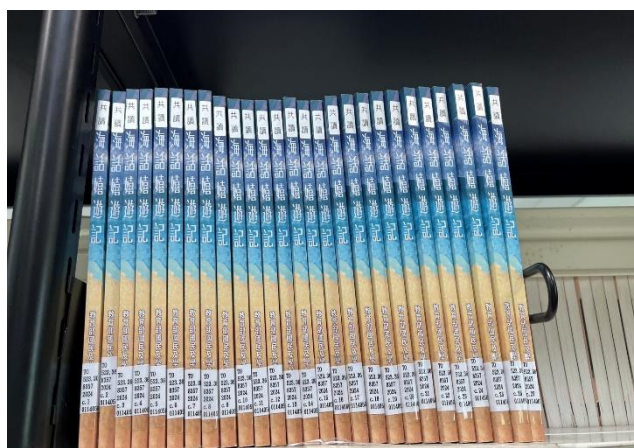
說明：閱讀推動海話嬉遊記-成為圖書館的共讀書