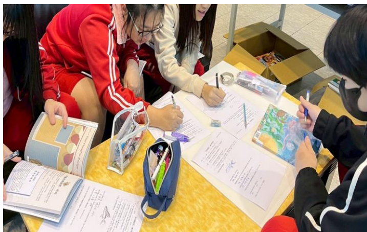
說明：閱讀推動海話嬉遊記共讀書2