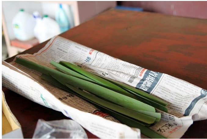
將除刺後林投葉捲捲捲，用橡皮筋固定住，用力一吹就可以發出聲響，完成林投喇叭哨。