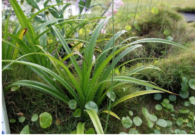
教師引導進行林投葉除刺