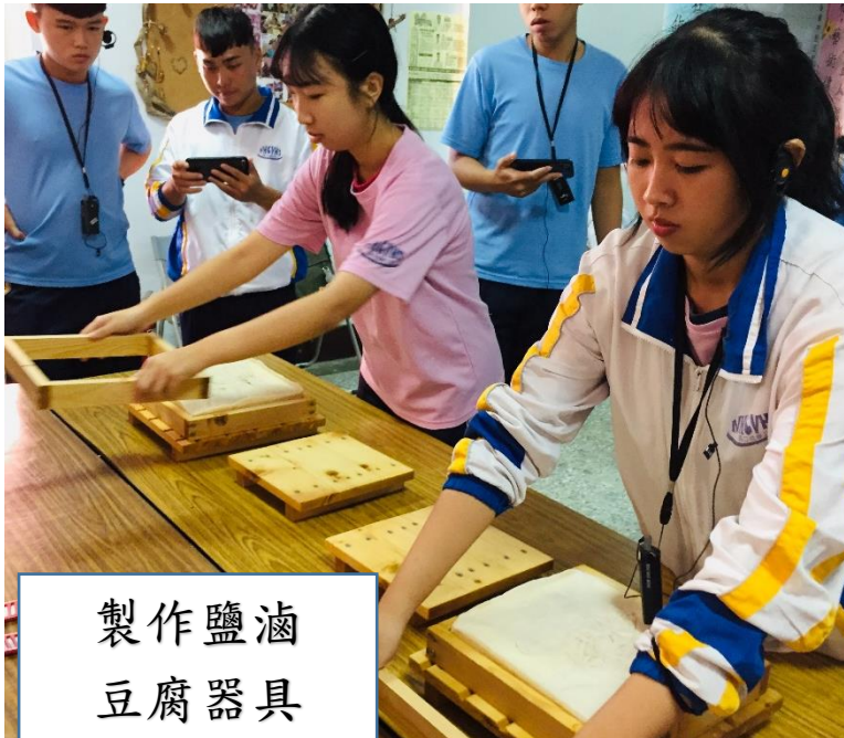
製作鹽滷 豆腐器具