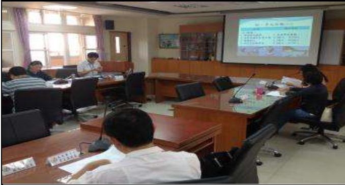
定期召開會議，規劃檢核海洋教育政策與成效