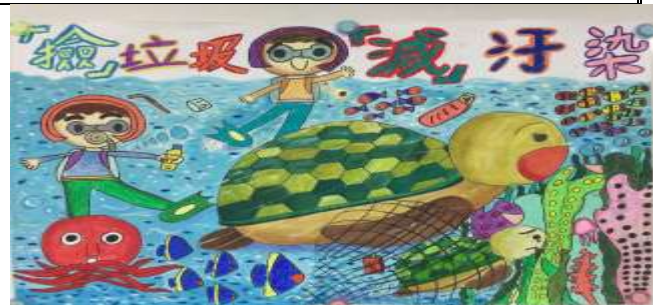
海洋教育漫畫及海報比賽