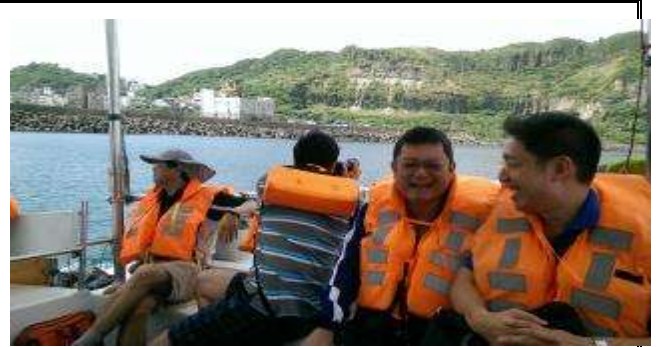
新北市教師海洋教育增能研習