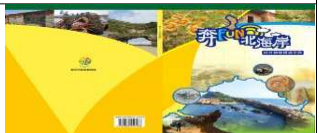
增印新北市北海岸教學手冊