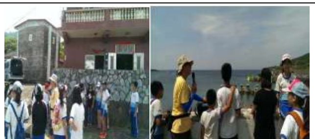
海洋文化探索夏令營