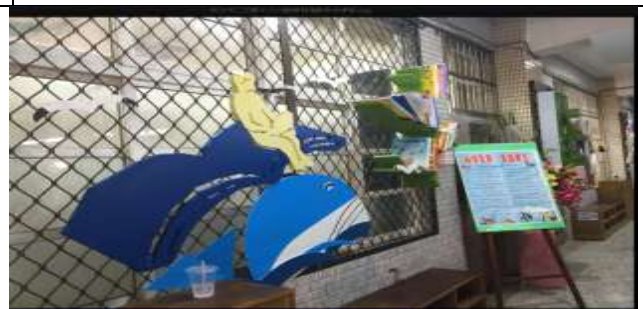
海洋教育月宣導活動