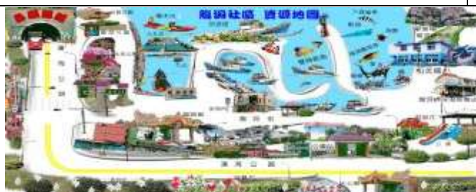
編印貢寮生態與人文遊學摺頁