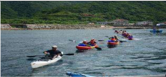
暑期海洋體驗探索夏令營