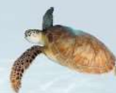
國小高年級組特優作品