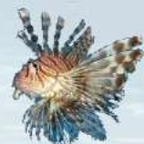
國小高年級組特優作品