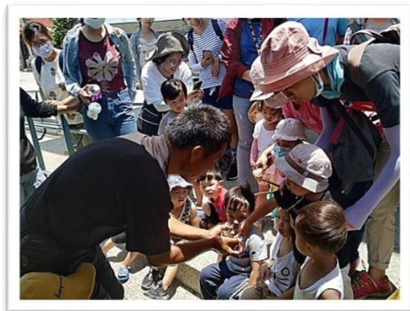
后里區七星國小遊學趣-文昌貝殼館認識貝類