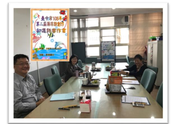
海洋教育之「河口生態趣味小學堂」撲克卡