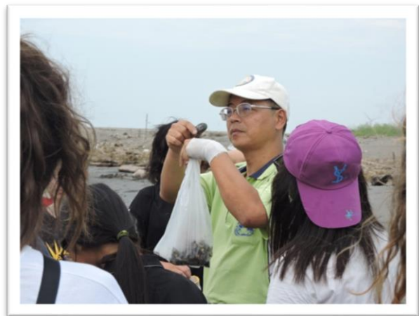
推動海洋教育-EIET 遊戲解說營解說導覽中