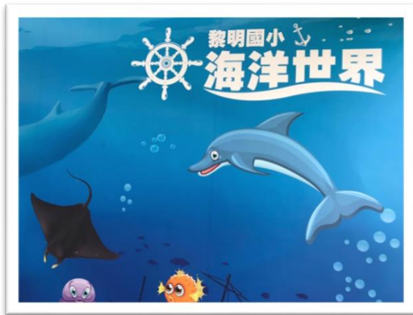
購置海洋教育相關圖書與媒體