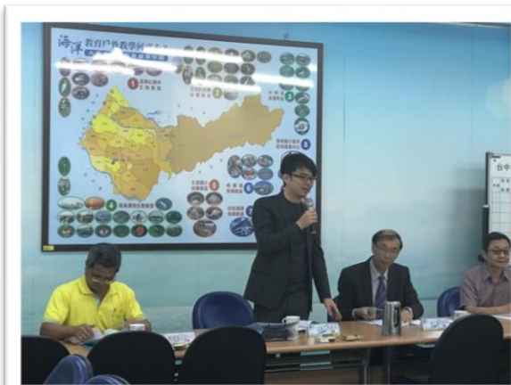
召開臺中市海洋教育推動小組會議