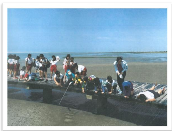
大里區立新國小遊學趣-高美濕地蟹類觀察