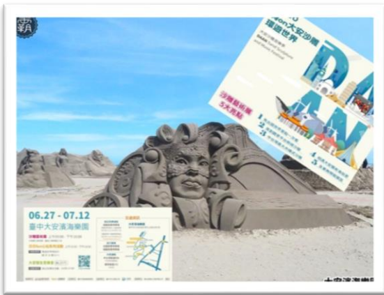
2020 大安沙雕音樂季-市政府推廣海洋遊憩