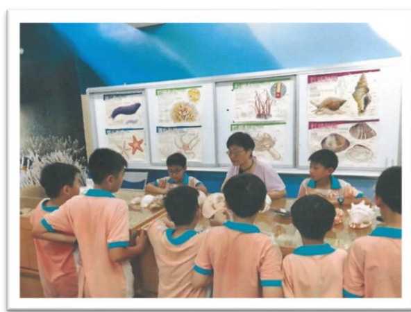
后里區七星國小遊學趣-文昌貝殼館認識貝類