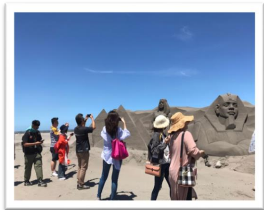
2020 大安沙雕音樂季-增添海洋藝文氣息