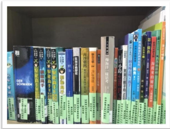
辦理海洋攝影藝文展