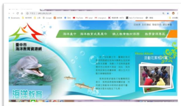
定期更新臺中市海洋教育資源網