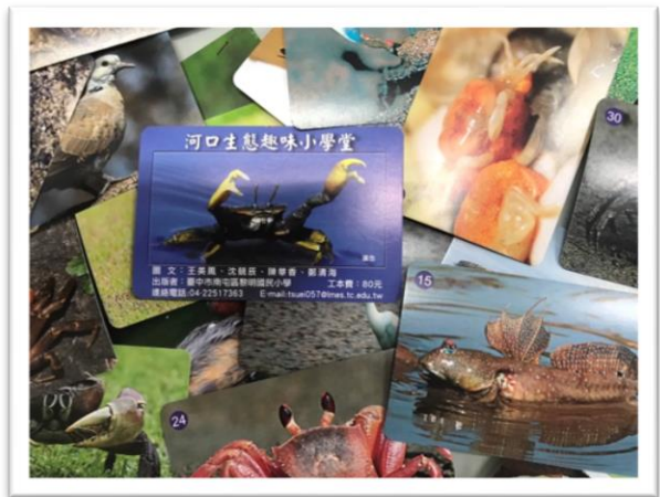
設計出版臺中市海洋教育文宣品