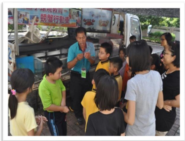
大里區立新國小遊學趣-高美濕地蟹類觀察