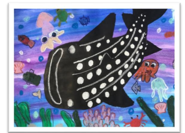
符應主題之海洋教育資源中心外牆