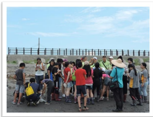
推動臺中市海洋教育的工作者-EIET 導覽中