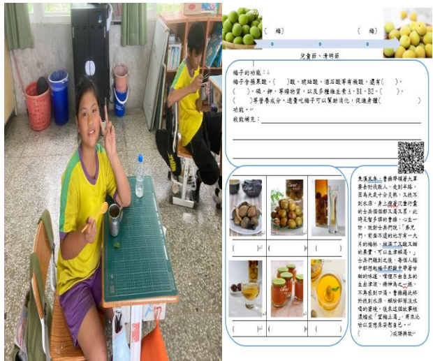
配合校訂彈性課程帶學生與社區餐飲老闆採訪並後續撰寫海報。