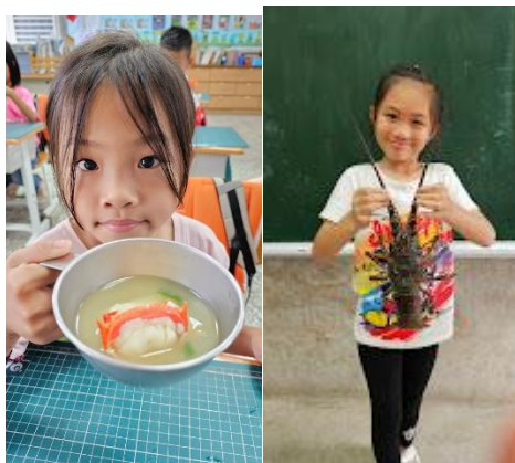
配合校訂彈性課程，學生認識從都蘭海裡活捉的龍蝦，最後師生共同品嚐龍蝦味噌湯。