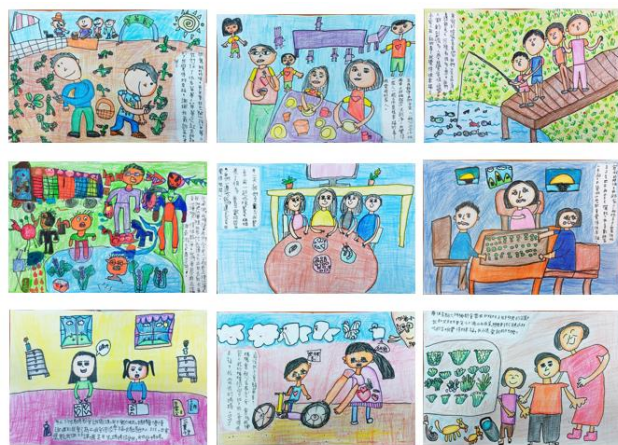
配合海洋課程繪製「我和家人的幸福時刻」學生作品。