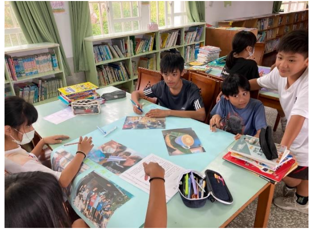
配合校訂彈性課程-種菜了，我們的蔬菜要好好長大。