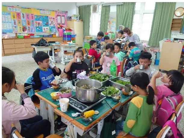
校訂彈性課程學生分組從菜園採收蔬菜、整理食材到切煮食材，完成蔬菜火鍋，最後品嚐與分享各組完成的蔬菜火鍋。