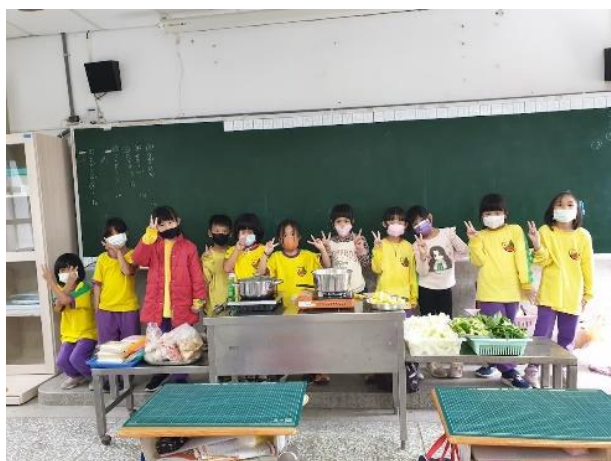
配合校訂彈性課程，學生從菜園採收蔬菜，清洗蔬菜，全班共同完成蔬菜火鍋，再一同共食共樂。