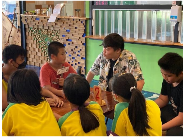
配合校訂彈性課程規劃從產地到餐桌課程，由整地開始。