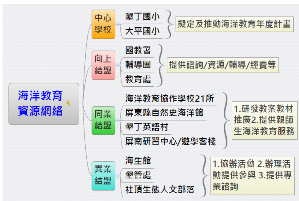
(二)運用資源發展海洋教育計畫架構圖