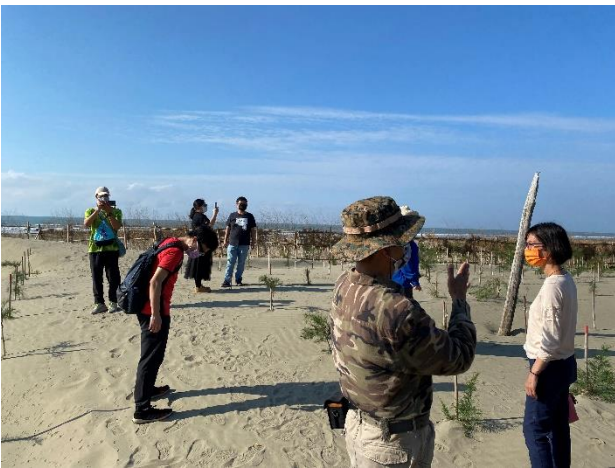
布袋港好美里海域生態踏查