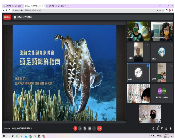
海洋教師社群增能