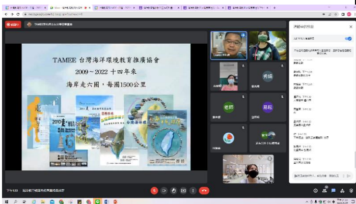
海洋教師社群增能