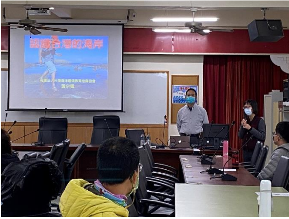
海洋種子教師培訓