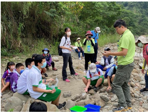
觸口河谷-找尋化石的技巧