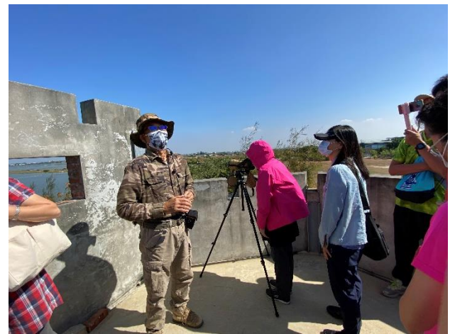
布袋港海域生態-觀鳥