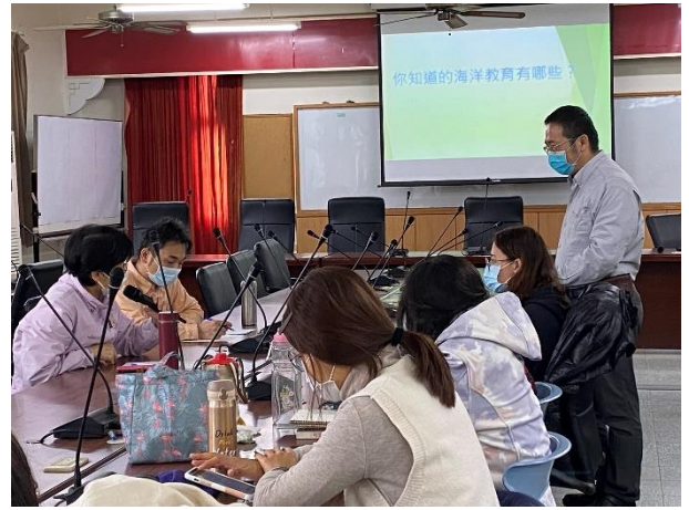
海洋種子教師培訓-討論實作