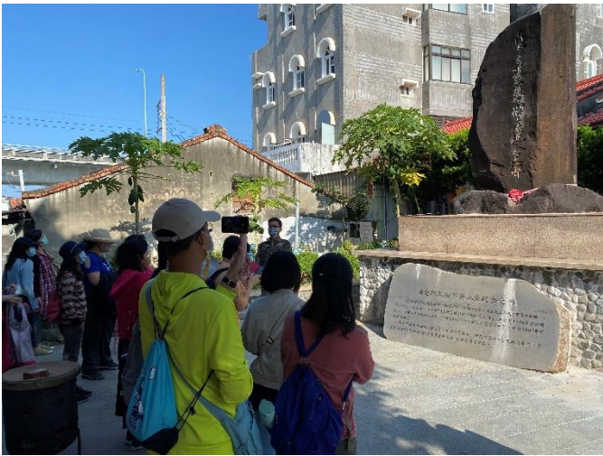
布袋港的人文與歷史