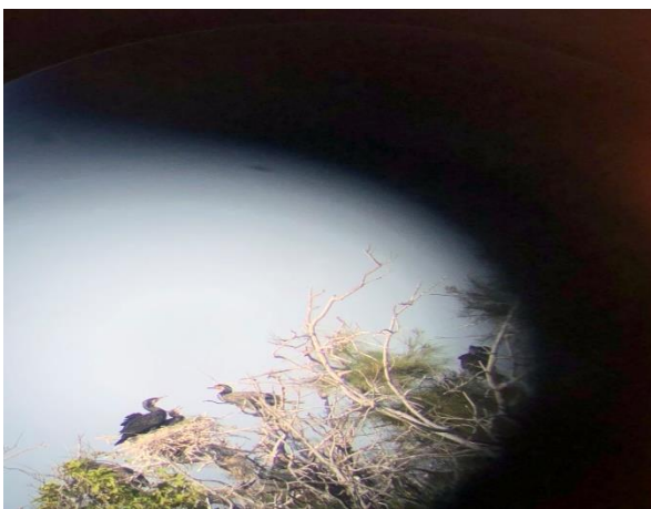
鰲鼓生態賞鳥-嘉義土生土長的鷺鷥誕生