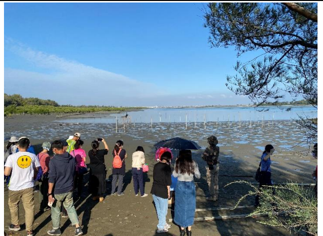
布袋港好美里海域生態踏查