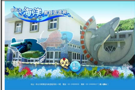
新北市海洋教育資源網首頁