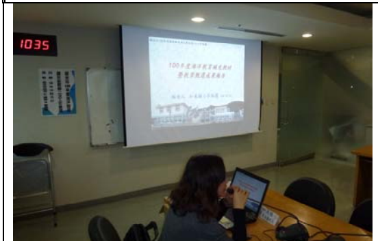
補充教材工作會議一