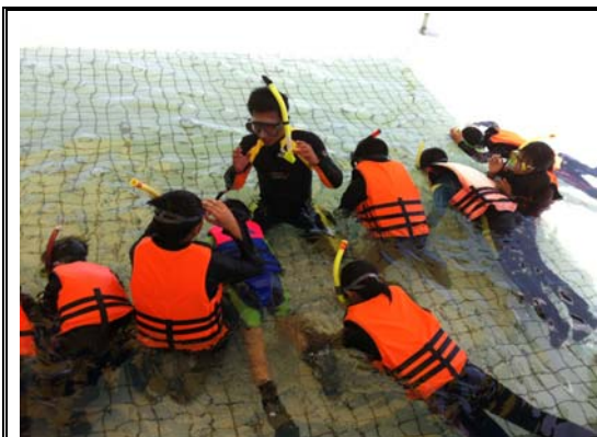
跨市(雙北市)臨海及非臨海學生海洋體驗營-呼吸管排水練習