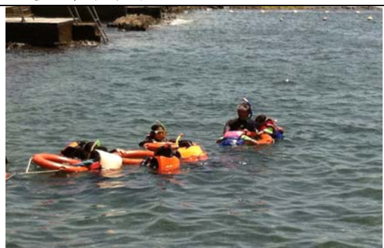
跨市(雙北市)臨海及非臨海學生海洋體驗營-優游於大海中