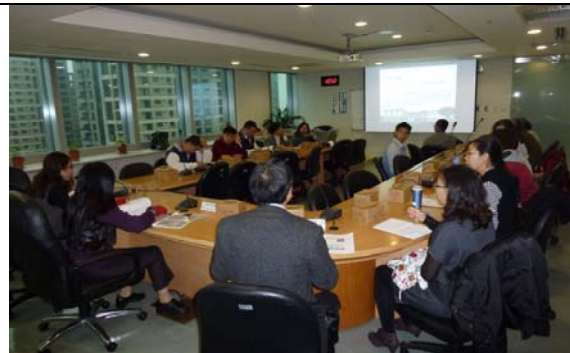
補充教材工作會議二