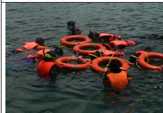
跨市(雙北市)教師暑期海洋體驗營-浮潛技能練習