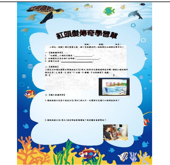
中心海洋教育資源專輯學習單