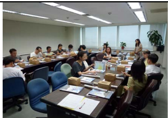
海洋教育推動小組工作會議一