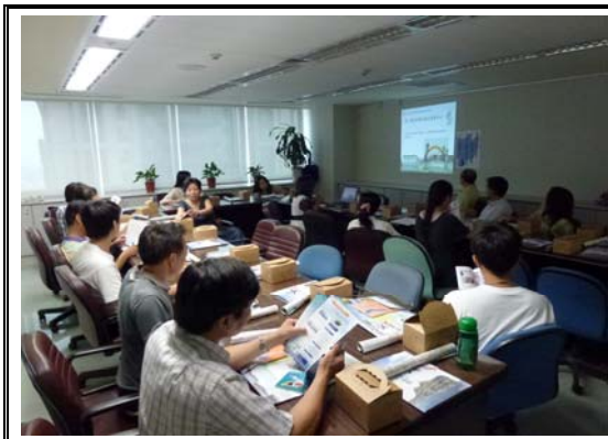
海洋教育推動小組工作會議一