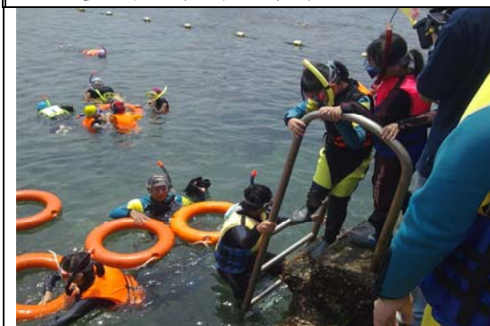
跨市(雙北市)臨海及非臨海學生海洋體驗營-到海洋中練習