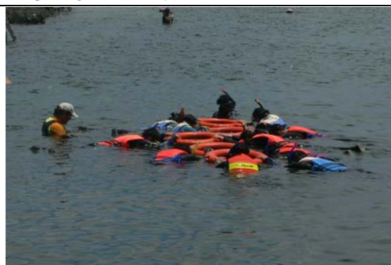
跨市(雙北市)教師暑期海洋體驗營-海洋生態觀察