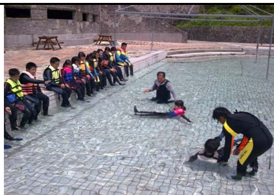
跨市(雙北市)臨海及非臨海學生海洋體驗營-仰漂練習