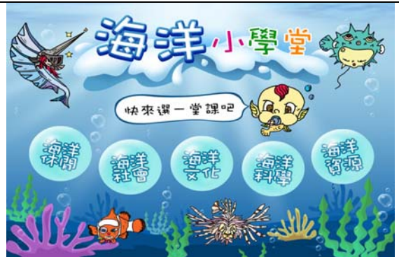
海洋小學堂互動式問答頁面