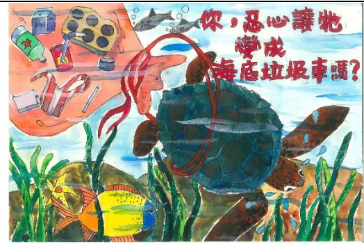
國小中年級組特優作品