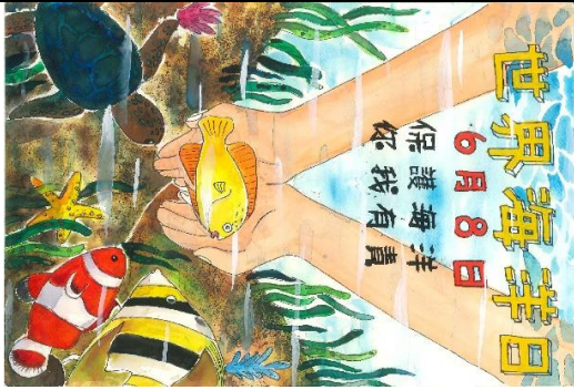
國小高年級組特優作品