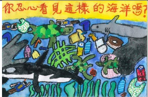
國小低年級組特優作品