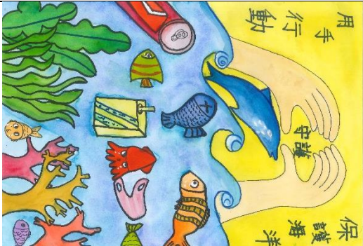
國小中年級組特優作品