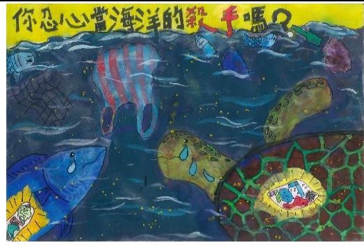
國小高年級組特優作品