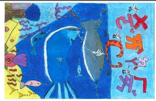
國小低年級組特優作品

(五) 2-1辦理海洋教育資源中心參訪計畫，總計到校參訪遊學學校及團隊共計20所：