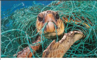
Turtles can't tell plastic bags from jellyfish, so they often eat the bags as food.