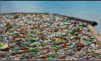
If we don't take action now, by the year 2050, there will be more plastic in the ocean than fish.