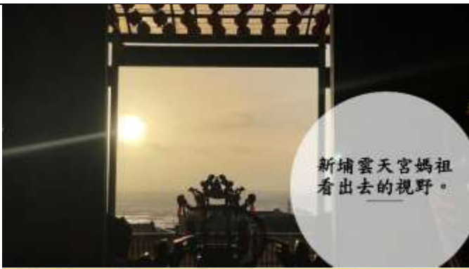
新埔雲天宮媽祖看出去的視野。