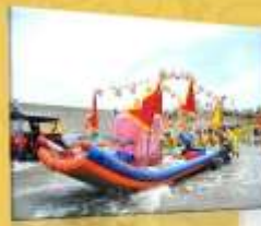
新埔天后宮媽祖海上遶境活動