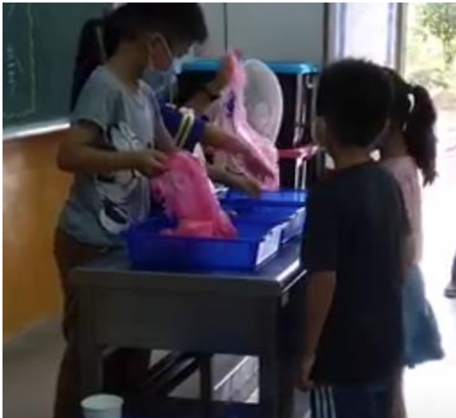
爸爸媽媽上市場，常常都提著一堆塑膠袋回家