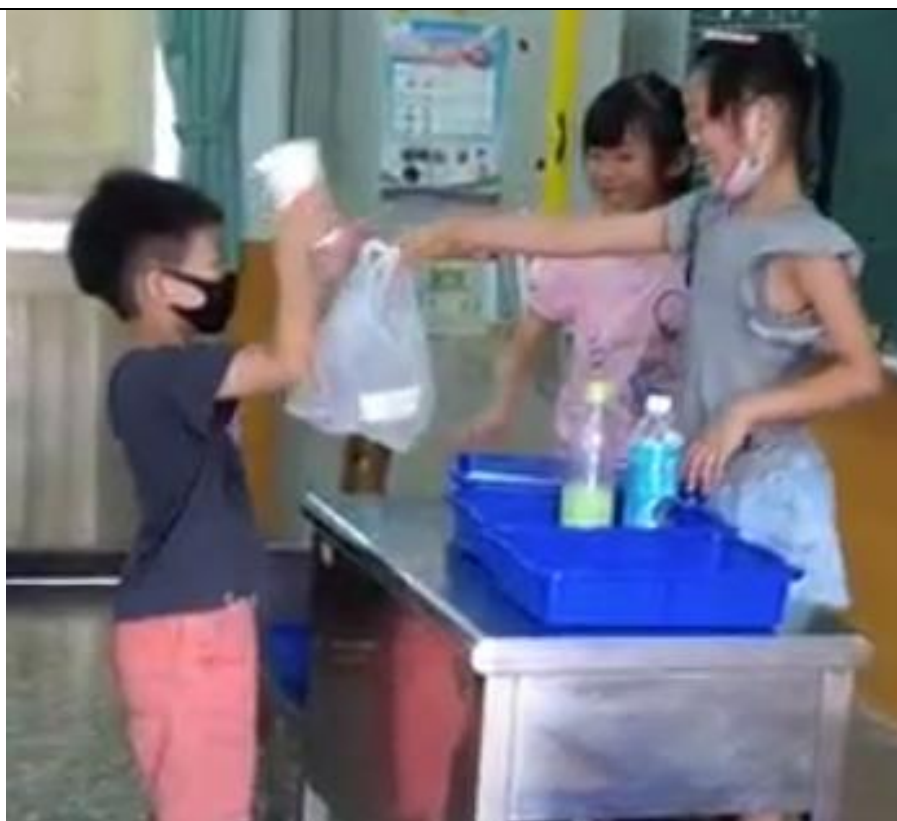
買早餐常帶回一堆塑膠袋、碗、杯