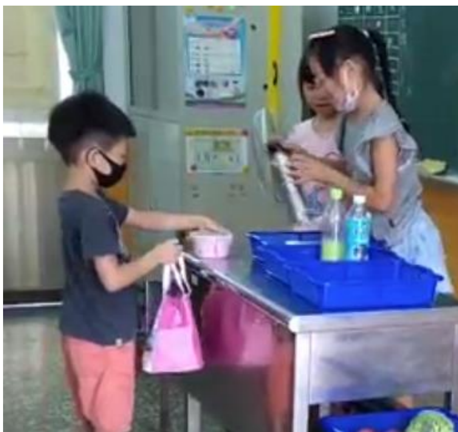
嗯 我知道了，帶著環保袋、碗，就沒有塑膠了