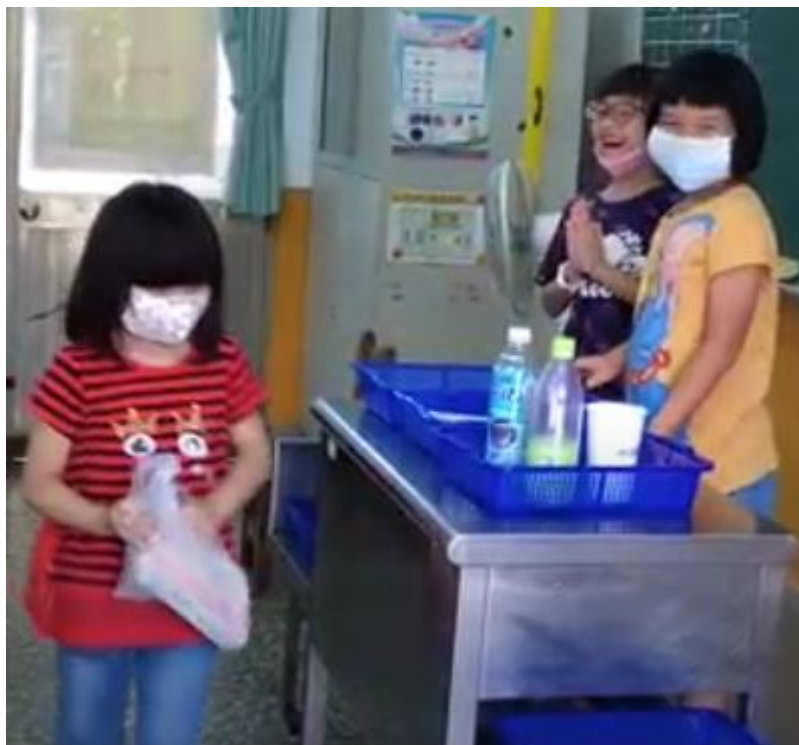
未帶任何用具，買回紙餐盒便當