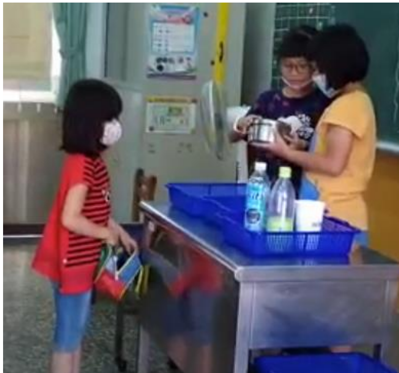
經思考過後，帶著環保碗和購物袋去買晚餐