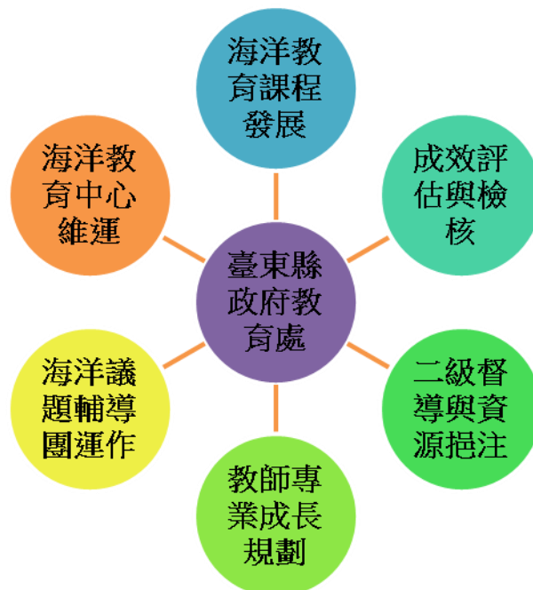
圖 1 臺東縣政府教育處推動海洋教育四年發展整體架構圖