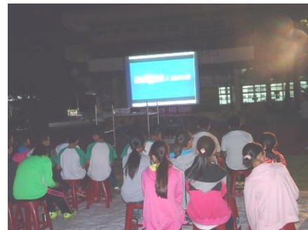
【說明】 以星空電影院為媒介，邀請師生及社區人士一同欣賞環境紀錄片「黑」