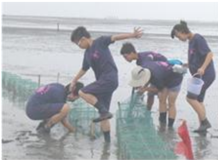
【說明】 芳苑國中辦理芳苑地區潮間帶實地踏查，讓師生瞭解潮間帶保育觀念