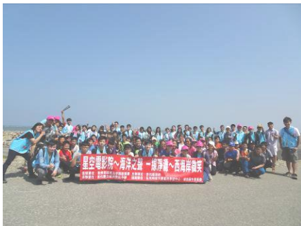
【說明】 由弘光科大服務學習中心協助辦理全縣淨灘，感受海洋現場的悲悽，並行動回饋