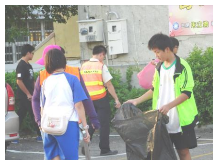
【說明】 掃街活動，實際行動關懷鄉里、關懷大地，並感受環境的真實面