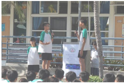
【說明】 海洋教育相聲，海洋與魚類跳脫框架，呈現在大家的「耳」裡