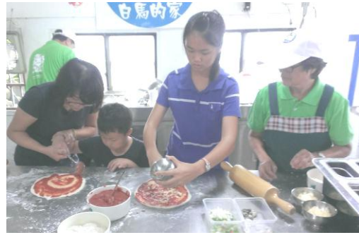
【說明】 親子、學生參加白馬的家社區海洋故事，並於講座後進行披薩實作