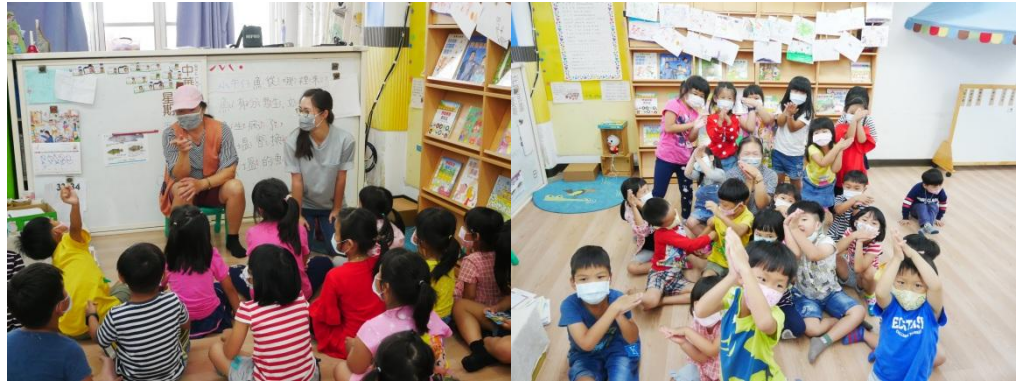
孩子們與魚專家互動，解除心中的疑惑