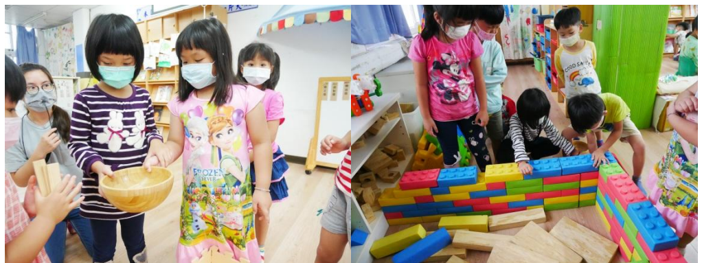
老師透過遊戲讓孩子們體驗漁民從魚卵→魚苗→成魚的過程