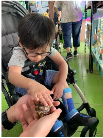
海洋教師及海洋志工引導孩子認識生物