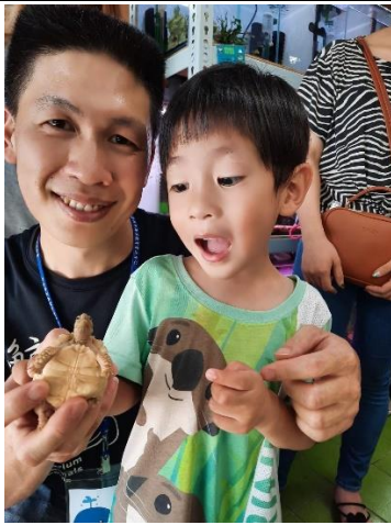
中組的孩子觸摸淡水龜，眼神充滿了好奇