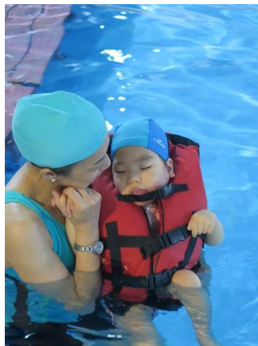
海洋志工協助低組孩子漂浮