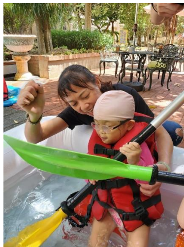
海洋志工協助中組孩子操槳