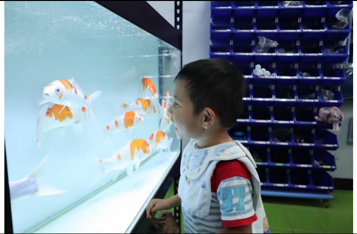
中組的孩子看著悠游的淡水魚，臉上掛滿了笑容