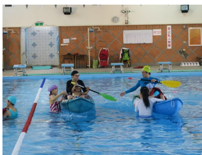
教師及海洋志工協助低組及中組孩子操舟