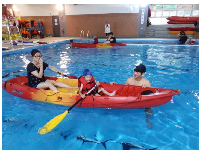
教師及海洋志工協助高組孩子操舟