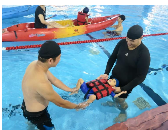
海洋志工及家長協助中組孩子漂浮