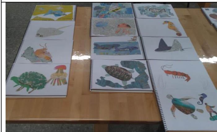
第二堂課結束，筆記本先收回來看看同學的整體狀況