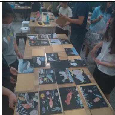
同學們互相評分狀況