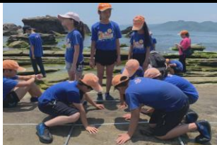
實際觀察潮間帶生物