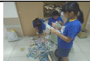
實踐海洋廢棄物分類再生