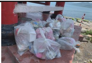
引導進行海洋廢棄物清理