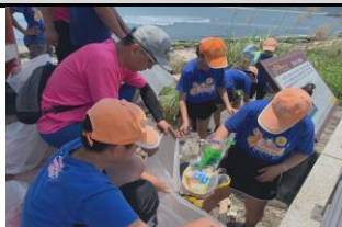
分組淨灘愛護海洋環境