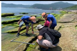
實地觀察監測記錄