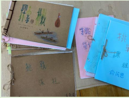
手寫手繪書面展出