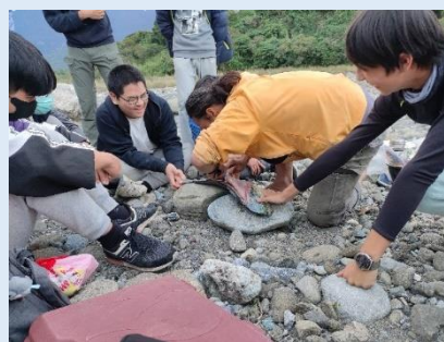
處理鬼頭刀並準備晚餐