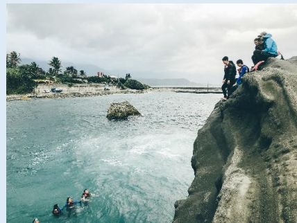
面對海洋勇氣訓練