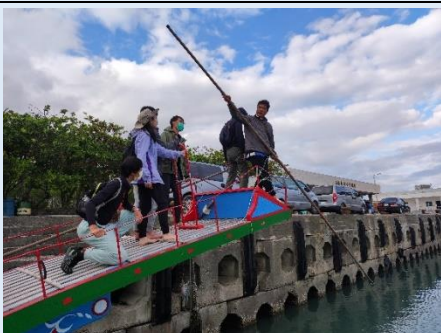
學生體驗站上旗魚鏢台