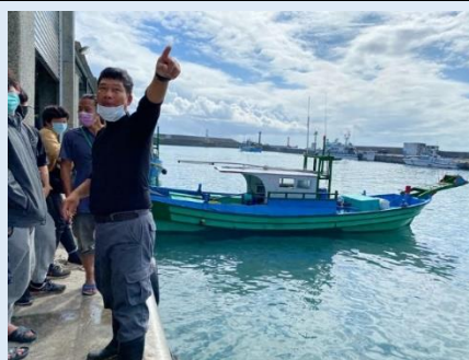
成功漁港老闆進行魚市場介紹