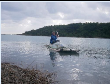
部落耆老傳統捕魚方式