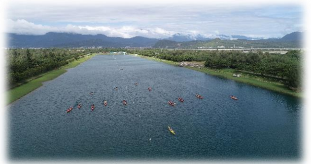
圖三、掌握能互相照應的隊形