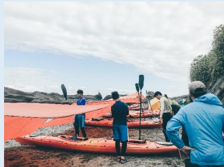
學生利用獨木舟搭建天幕