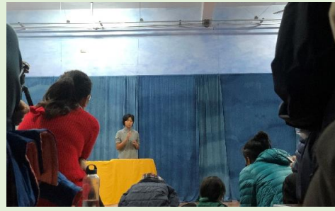
仁美國中口頭報告