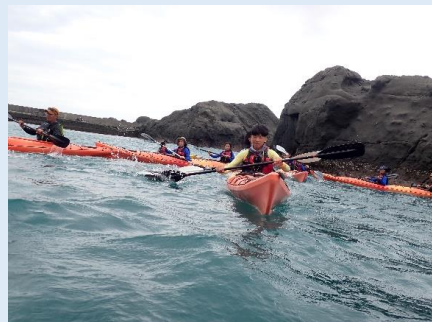
獨木舟航海—石雨傘