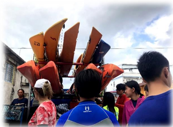
圖一、學習如何保護及移動裝備

獨木舟從倉庫至湖水，需要學習如何搬運與組裝，如圖一學生正在練習將獨木舟固定於搬運車上。緊接著是固定及保護裝備，透過由愛惜裝備、基本保養修繕和正確使用裝備使學生能理解各個裝備特性，以利突發狀況自我保護。而航行，首先從平衡開始練習，風平浪靜也要學習平衡，掌握身體感知以及協調肢體動作，經由感受風與浪的拍動，與獨木舟一起划出穩健優美的水線。課程將以平靜湖水作為初始練習的地點，學生學習獨木舟航行的基本安全、水域知識與緊急措施並嘗試在無浪的情況下使獨木舟能穩定平衡，由 3 位教練分別帶領不同協調能力的學生進行分組練習，直至能夠平穩划行於平靜水域，練習為期一天時間。