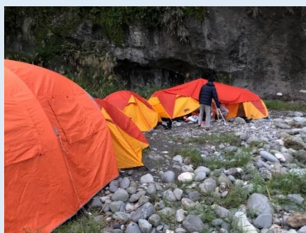
港口部落的野營生活