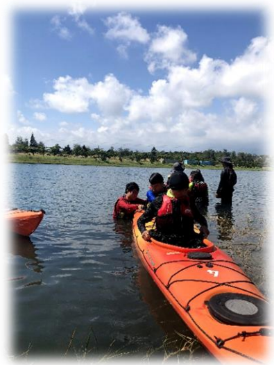
圖二、學習獨木舟的結構原理

第三、四天海上獨木舟航行旅行課程，由三位教練帶領學生進行較長距離的獨木舟旅行課程，包含海域、海洋與生態介紹與自身與海洋的關係探索，藉由與大海相處充分的時間沉澱自我並自我探索。在旅程中與同儕能合作解決困難，培養團隊解決問題的能力，發掘自我在團隊的價值，同時也在個人航行中學會獨立，照顧自己。並在第五天進行心得感受發表分享會，將五天的心得透過照片或繪圖等方式表現，輪流以短講的模式進行，強化學生在表達時系統組織呈現與傾聽他人給予回饋的兩項能力。