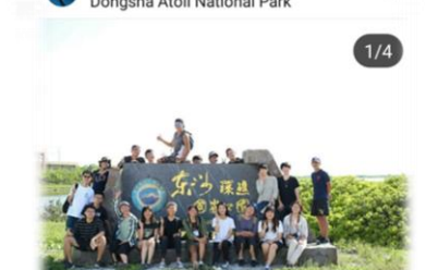
按讚的人 1995loststar、ab76527652和其他109人