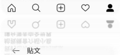
按讚的人 em_angies、wei0chen0322和其他102人

kentaco13145720 炎炎夏日 藍天白雲 不輸給希臘的白色建築 這裡是台灣海島 我們也有世界級的風景 給我機會介紹小島 讓台灣走向全世界