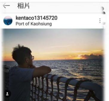
按讚的人 1995loststar、em_angies和其他115人

kentaco13145720 美麗東沙 飄揚著青天白日滿地紅的旗幟 這裡是兵家必爭之地 一個敬禮 感謝駐守在此的弟兄們