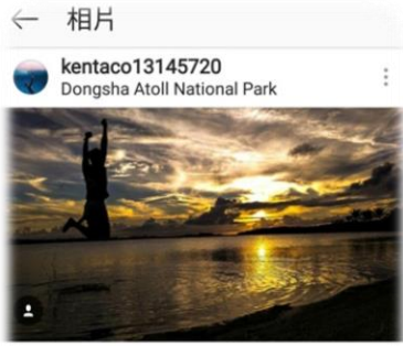
按讚的人 em_angies、wei0chen0322和其他119人

kentaco13145720 自己的人生自己決定 自己負責 沒有絕對正確或錯誤 重點是讓自己開心 不用擔心