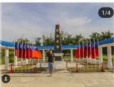
按讚的人 em_angies、wei0chen0322和其他89人

kentaco13145720 美麗東沙 飄揚著青天白日滿地紅的旗幟 這裡是兵家必爭之地 一個敬禮 感謝駐守在此的弟兄們