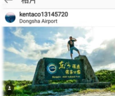
按讚的人 1995loststar、em_angies和其他128人

kentaco13145720 碧海藍天 陽光沙灘 這裡是台灣的小島 擁有不輸給國外的風景 卻也是被垃圾攻擊的首衝之地 沒有遊客的東沙 卻面臨海洋垃圾的污染