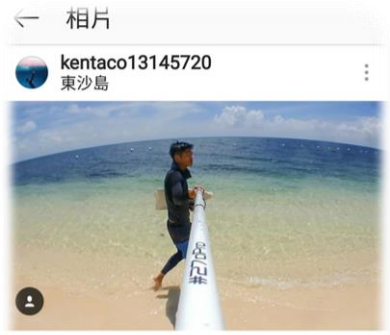
按讚的人 wei0chen0322、jose_tzeng和其他109人

kentaco13145720 一場難得的經歷 第一次的軍艦生活 第一次的海上過夜 第一次完全看不到陸地 第一次遠離台灣卻不是搭飛機