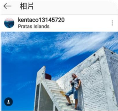
按讚的人 1995loststar、wei0chen0322和其他142人

kentaco13145720 在艦上等待入港中 一趟旅途就這麼結束了 島邊心近 一句代表東沙的話 感謝這次遇到的所有人 永遠不會忘記這次的旅行