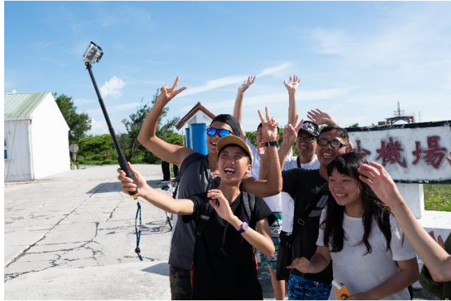
熱情的夥伴們是那麼的可愛

在東沙的我們沒有一個人想要回去台灣，即使高雄艦早已在外海等著，準備帶著我們，駛回高雄，沒有人想要回去，總是希望再做一些難忘的事：誰知道還有沒有機會再來呢？