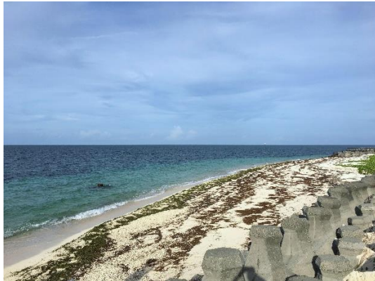
美麗沙灘與層出不窮的海草

(小小的發個牢騷，我和幾個有潛水經驗的夥伴都覺得非常可惜，因為這和原本的想像有一點小落差。由於主辦單位擔心學員的安全，增加了許多限制，像是每個學員都有一位阿兵哥伴游、全部強制穿上救生衣、不能游超過距離海岸過遠的範圍等等，無法像在台灣自由潛水那樣，隨意帶個浮潛三寶，就能自在下潛觀賞海底風光。雖然不如預期，但能在海邊與大家戲水玩耍，又深知主辦單位的用心良苦，也不好意思多說什麼了。再一次對辛苦的負責單位說聲謝謝！)