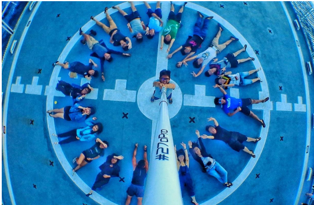
想念東沙，想念你們