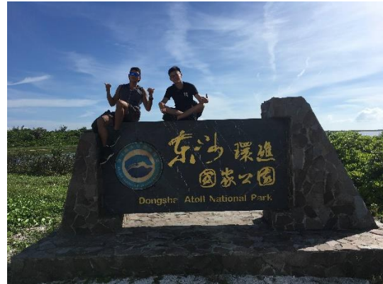
與東沙環礁國家公園碑合影