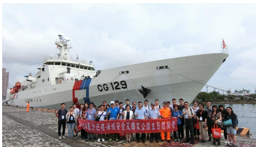
來~大家看前面喔~ 西瓜甜不甜？

利用漫長的航程，艦長特別帶我們參觀了駕駛室，非常親切並且詳細的說明操作板各個儀器的每一個功能。參觀時看著船艦從上到下每個忙碌的身影，就真心佩服這些長期航程的船員不辭辛勞，為的就是讓船圓滿航行到遙遠的東沙，打從心底能夠執行這樣的遠航任務真的非常厲害。