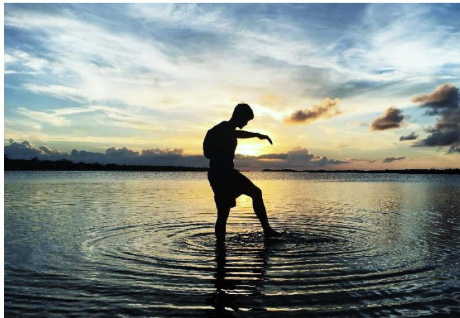
致美麗的南海明珠