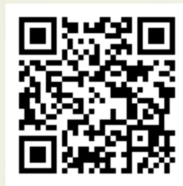
教育部戶外教育資源平臺