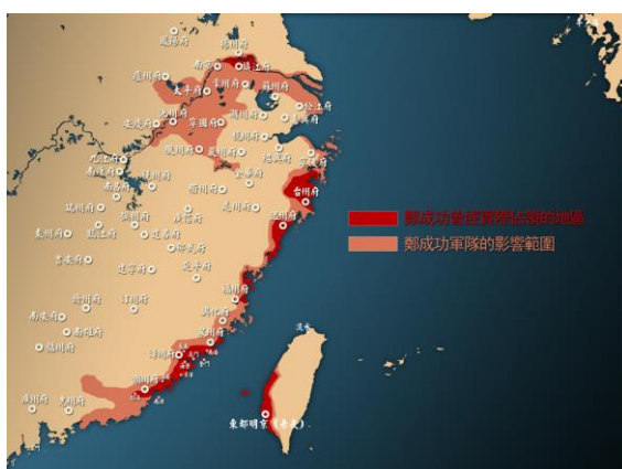
明末海盜活動路線