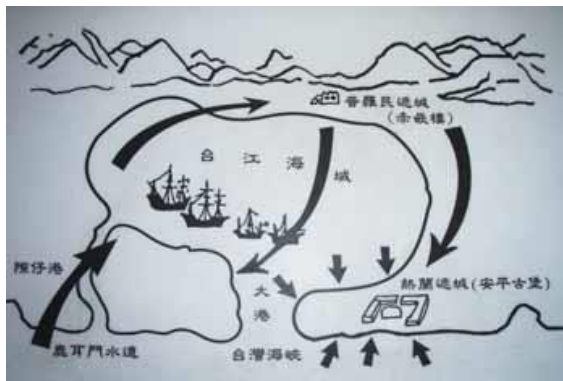
鄭成功進軍路線圖