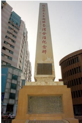
北港嚴思齊紀念碑