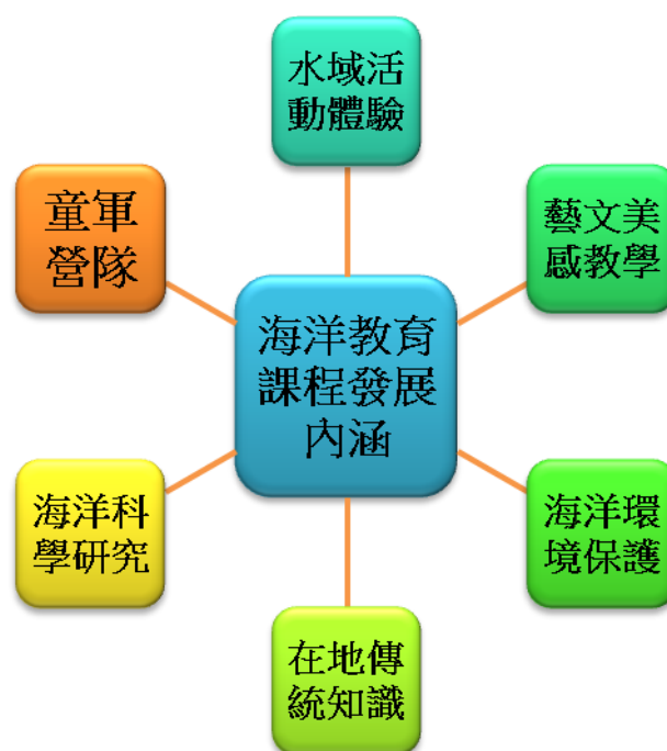
圖 3 臺東縣海洋教育課程內涵圖