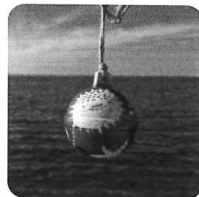
※海洋教育校園公共藝術